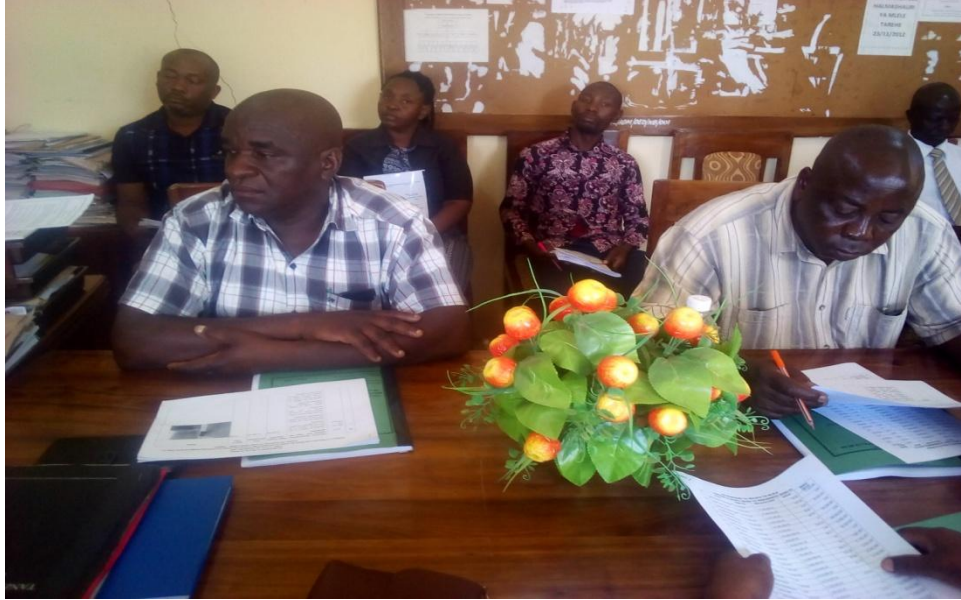
Wajumbe wa kikao cha Kamati ya Fedha na Mipango kwa ajili ya kupitia na kujadili Mpango wa bajeti wa Halmashauri Wilaya ya Mlele kwa mwaka wa fedha wa 2021/2022.